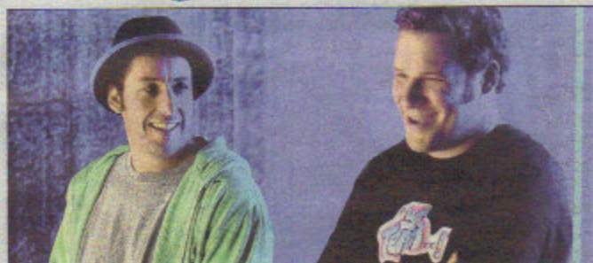
Komiker: Georges (A. Sandler, li) und Ira (S. Rogen).

Ein lustiger Film zu einem ernsten Thema ist ein gewagtes Unterfangen und eine Gratwanderung. Judd Apatow hat es versucht und mit Adam Sandler einen ausgewiesenen Komiker für die Hauptrolle engagiert, doch das amerikanische Kinopublikum hat den Film nur verhalten aufgenommen.